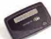
1-Kanal alphanumerischer Pager