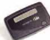
und 1-Kanal alphanumerischer Pager