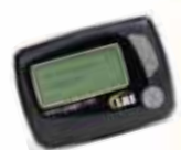
Multi-Kanal alphanumerischer Pager