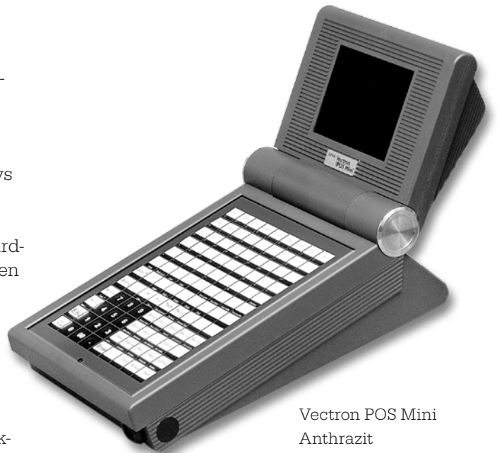
Vectron POS Mini Anthrazit