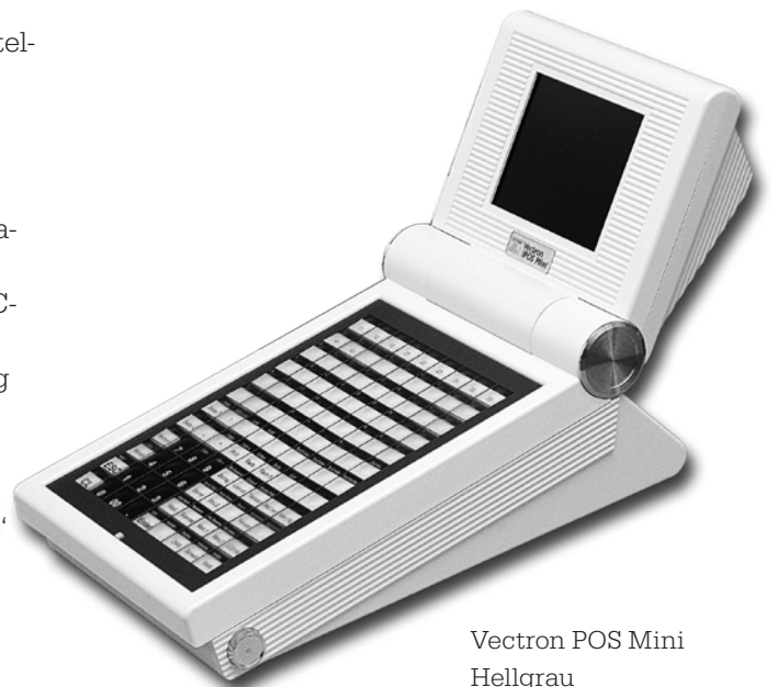
Vectron POS Mini Hellgrau