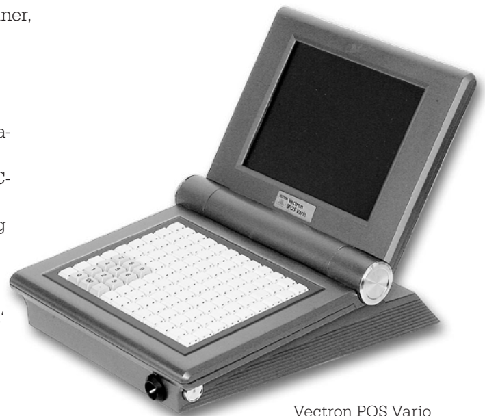
Vectron POS Vario mit Hubtastatur