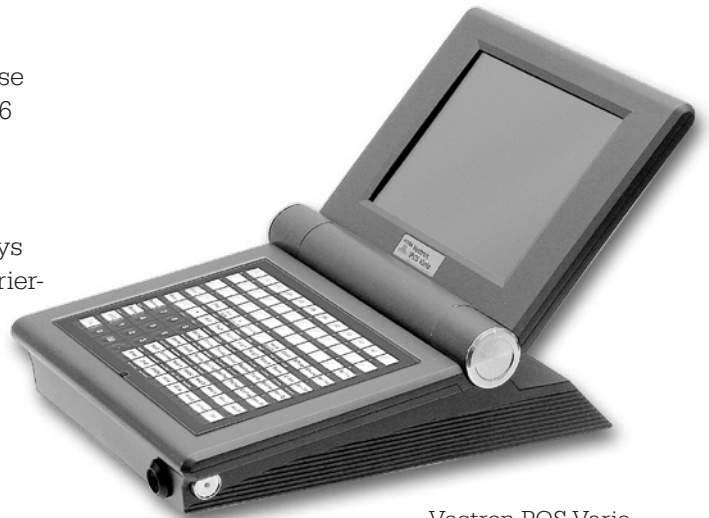
Vectron POS Vario mit Folientastatur