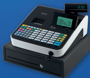
ECR-1880RD Hubtastatur, Schublade mit Sonderausstattung Kellnerschloss