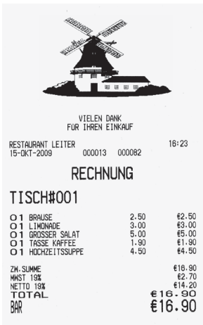
Bonmuster Abb. verkleinert

Eine USB- und 2 serielle Schnittstellen für den Anschluss von PC, Küchen- und Rechnungsdrucker bzw. Scanner sind serienmäßig im Modell ECR-1880 verbaut