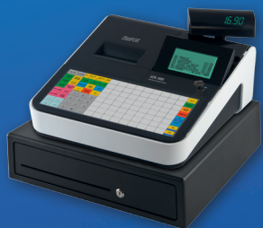
ECR-1880FD mit Schublade